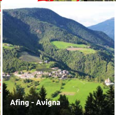
Afing - Avigna