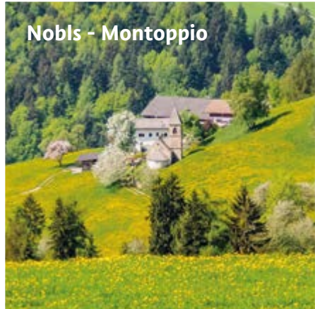
Nobls - Montoppio