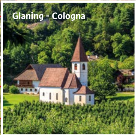
Glaning - Cologne