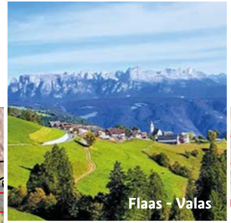
Flaas - Valas