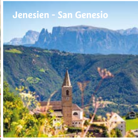
Jenesien - San Genesio

Sarner Scharte Forcella Sarentina 2468 m